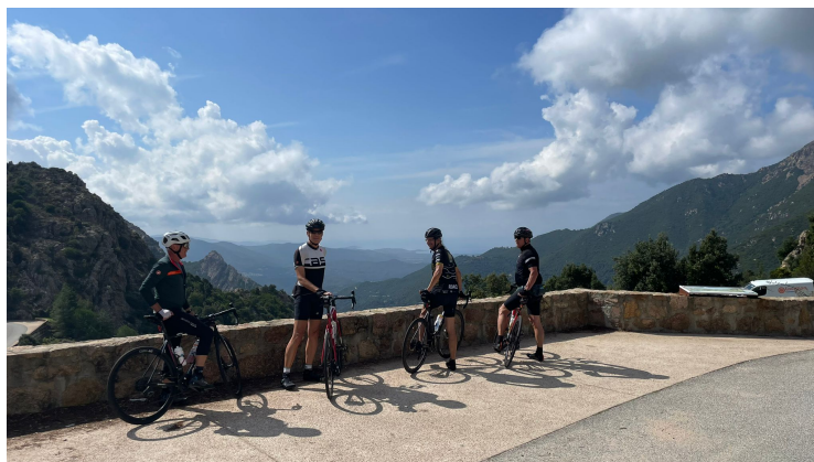
Jour 3 - Saint Florent - Calvi