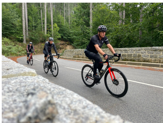
Jour 8 - Fin du séjour