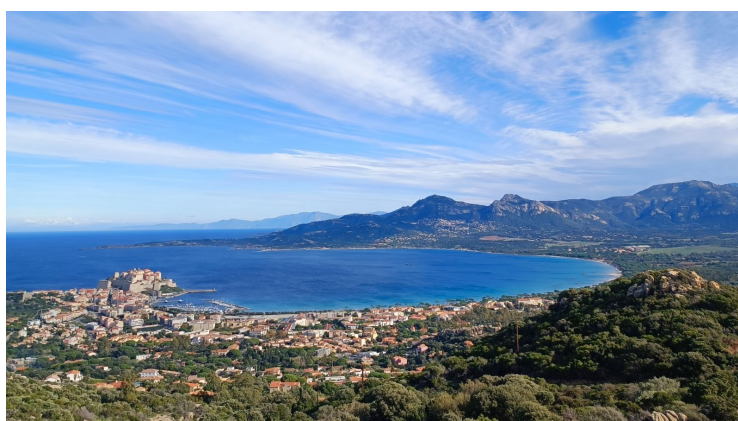
Jour 4 - Calvi - Porto