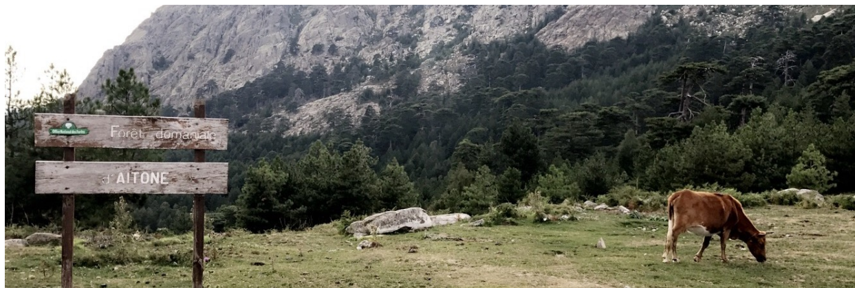
Jour 6 - Corte - Zicavo