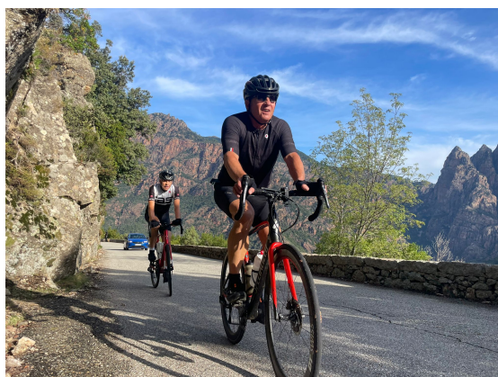
Jour 7 - Zicavo - Bonifacio